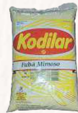
FUBÁ MIMOSO KODILAR - PCT 5 KG CÓD: 145