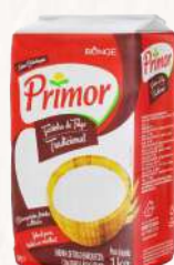
FARINHA DE TRIGO TIPO 1 PRIMOR - 10X1KG CÓD: 1130