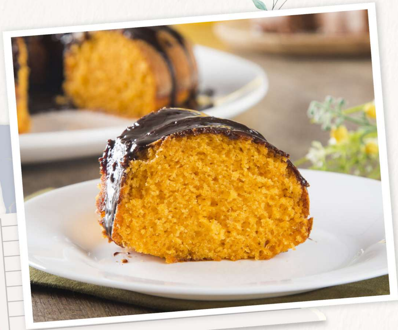
Bala de Cenoura