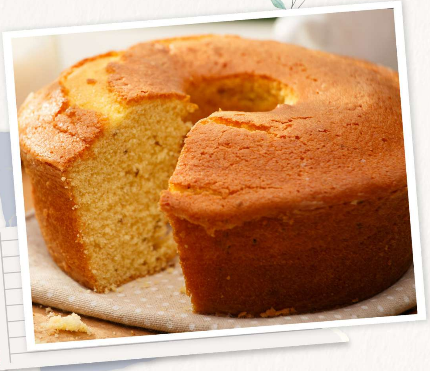
Bola de Fubá