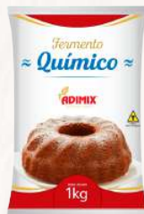
FERMENTO EM PÓ ADIMIX 1 KG CÓD: 958