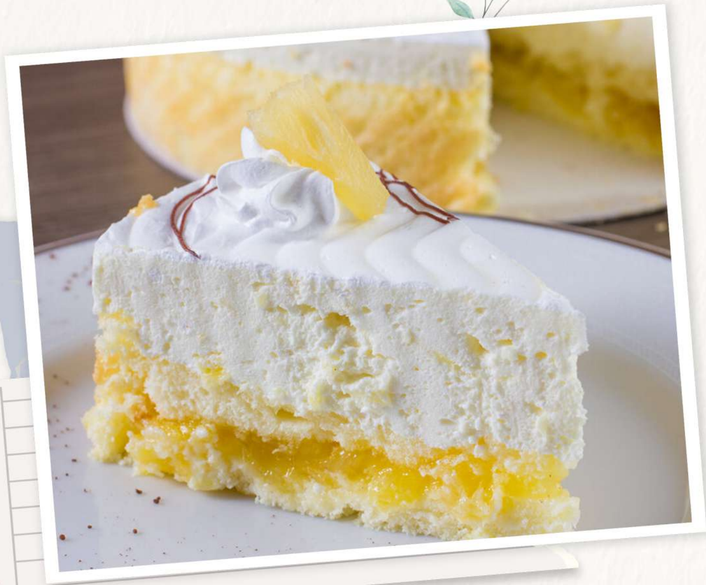
Bola Gelada de Abacaxi