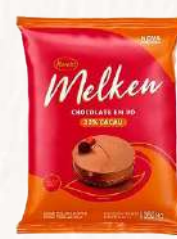
CHOC. EM PÓ MELKEN 33% - 1,05 KG CÓD: 1541