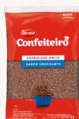
CHOC. GRANULADO MÁCIO CONF. HARALD - 1,05 KG CÓD: 113