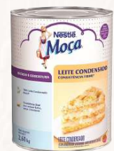
RECHEIO LEITE CONDENSADO NESTLÉ 2,61 KG CÓD: 519