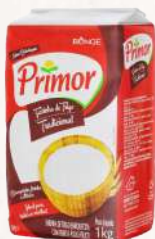
FARINHA DE TRIGO TIPO 1 PRIMOR - 10X1KG CÓD: 1130