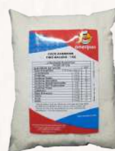
COCO RALADO AMERIPAN FINO 1 KG CÓD: 1302