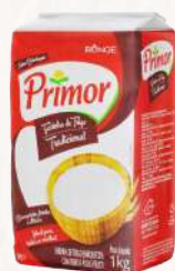
FARINHA DE TRIGO TIPO 1 PRIMOR - 10X1KG CÓD: 1130