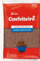
CHOC. GRANULADO MÁCIO CONF. HARALD - 1,05 KG CÓD: 113