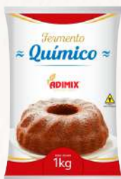
FERMENTO EM PÓ ADIMIX 1 KG CÓD: 958