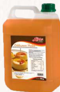
CALDA P/ PUDIM LISSE 5 KG CÓD: 1916