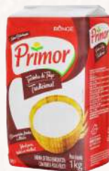
FARINHA DE TRIGO TIPO 1 PRIMOR - 10X1KG CÓD: 1130