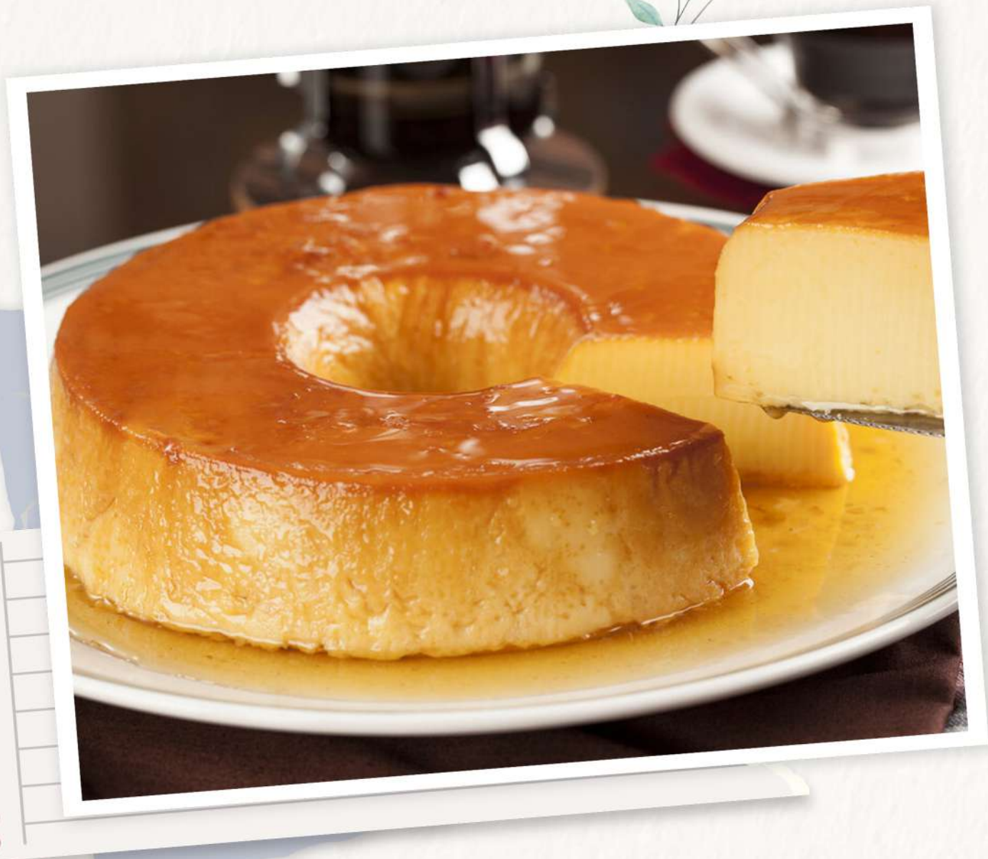
Pudim de Leite