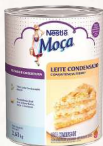
RECHEIO LEITE CONDENSADO NESTLÉ 2,61 KG CÓD: 519