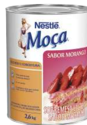
RECHEIO MORANGO NESTLÉ 2,6 KG CÓD: 1147