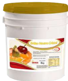
GELEIA BRILHO CRISTAL ADIMIX 4 KG CÓD: 1818