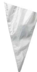
SACO CONF. DESCARTÁVEL GRANDE PCT C/ 50 UN CÓD: 1595