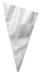
SACO CONF. DESCARTÁVEL GRANDE PCT C/ 50 UN CÓD: 1595