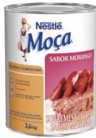
RECHEIO MORANGO NESTLÉ 2,6 KG CÓD: 1147