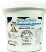
MASSA BRIGADEIRO DELEITE 4,6 KG CÓD: 211