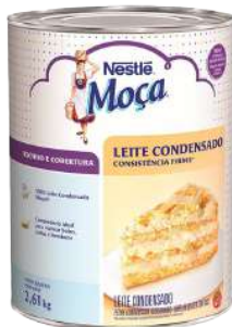
RECHEIO LEITE CONDENSADO NESTLÉ 2,61 KG CÓD: 519