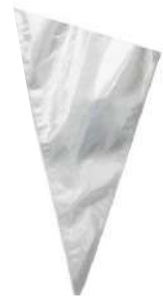
SACO CONF. DESCARTÁVEL GRANDE PCT C/ 50 UN CÓD: 1595