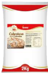
COBERTURA P/ COLOMBA E MACARON ADIMIX 2 KG CÓD: 1615