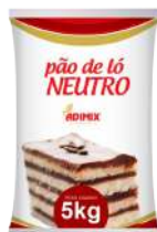
MIST. PÃO DE LÓ ADIMIX 5 KG CÓD: 1369