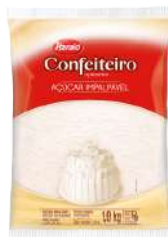
AÇÚCAR CONFEITEIRO HARALD 1 KG CÓD: 1108