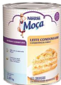
RECHEIO LEITE CONDENSADO NESTLÉ 2,61 KG CÓD: 519