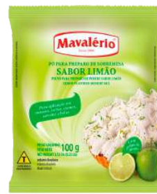
PÓ LIMAO MAVALÉRIO PCT 100 G CÓD: 2164