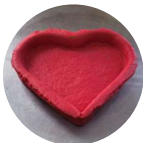
BASE TORTA DOCE 15 CM CORÇÃO VERM. AMERIPAN 12 UN CÓD: 2321