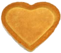
BASE TORTA DOCE 15 CM CORÇÃO AMERIPAN 12 UN CÓD: 467