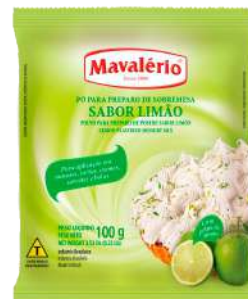
PÓ LIMÃO MAVALÉRIO PCT 100 G CÓD: 2164