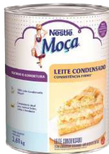
RECHEIO LEITE CONDENSADO NESTLÉ 2,61 KG CÓD: 519