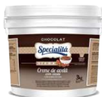
SEL. CREMA PASTA CHOCOLATE COM AVELÃ 3 KG CÓD: 1191